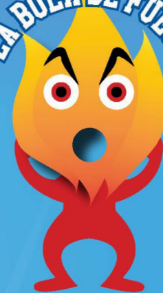
LA BOLA DE FUEGO

No deje que niños jueguen en toboganes, resbaladillas o cualquier otro juego cuya superficie esté caliente.