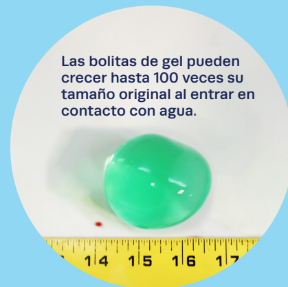
Las bolitas de gel pueden crecer hasta 100 veces su tamaño original al entrar en contacto con agua.